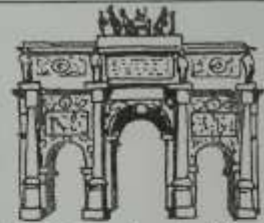
Arc de Triomphe du Carrousel.